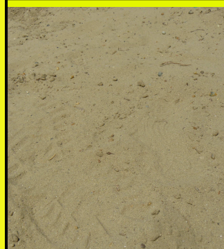
Nyomok a homokban

A gyilkosságok sem ritkák. Több esetben az egész expedíciót lemészárolták és kirabolták. Egy feldükködött falu lakói akiknek a családi sírjait felforgatták, megtámadták a régészeket. Szerencsére manapság már visszaestek az ilyen fajta bűnesetek, de –mint az Iraki példa mutatja- még mindig előfordulhatnak.