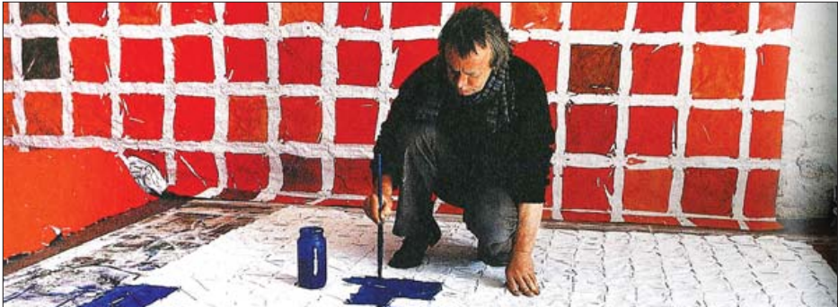
A Poliográf illusztrációi HANTAI SIMON munkái.

Forrás: http://www.ludwigmuseum.hu/site.php?inc=kiallitas&kiallitasId=897&menuId=44