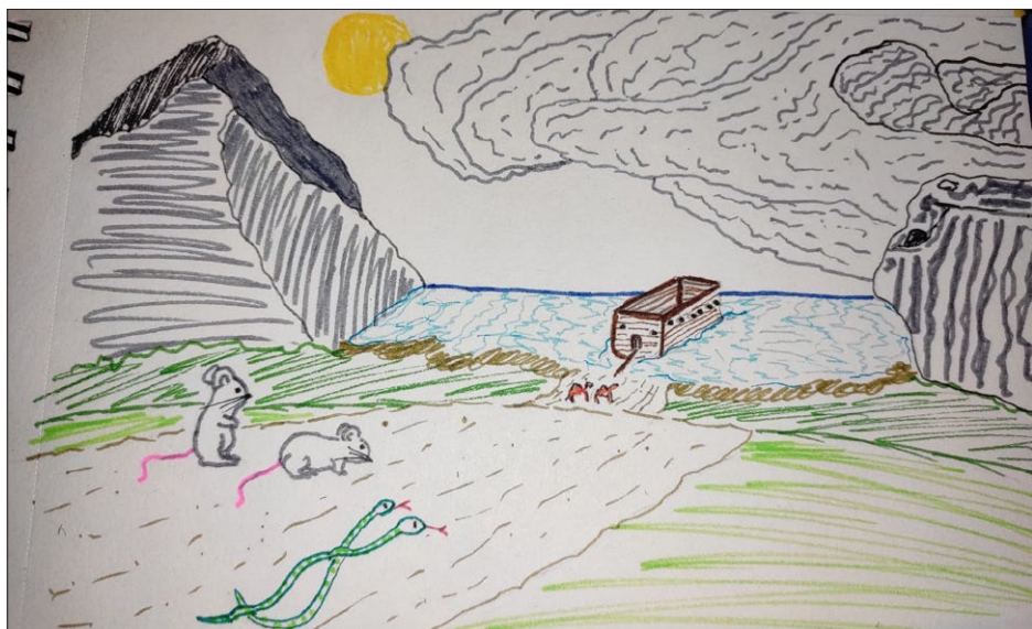
Grósz Tamara illusztrációja

Ajánlanám magamat a postás munkakörre. Szinte a világ teremtése óta futár/hírvívő voltam a legnagyobb globális cégnél, a tulaj és egyben főnök ügyeit és leveleit intéztem szerte a világban. Hozzá vagyok szokva a folyamatos munkához, pihenő nélküli utazáshoz, de mára egy kicsit